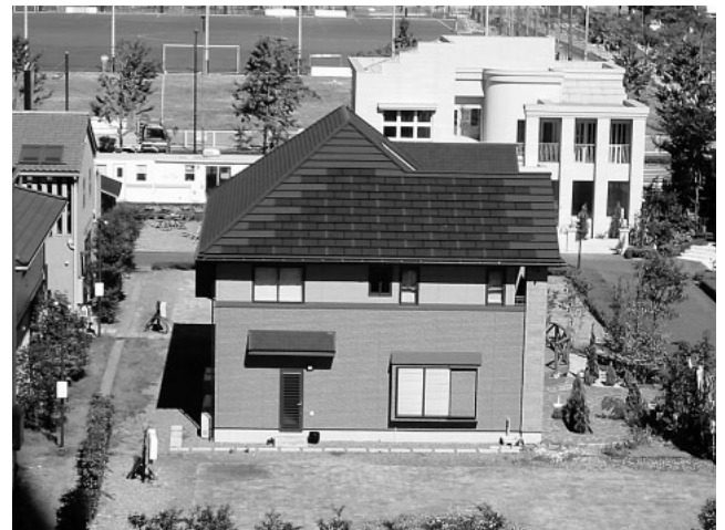
図5 住宅用瓦一体型太陽電池適用例（1.5kWシステム）

住宅用の屋根瓦に当社製アモルファス太陽電池を組み込んだ“瓦一体型太陽電池”の適用例を図5に示す。ダークブラウン色の落ち着いた色合いで、屋根と一体化したシンプルなデザインは住宅の美観を一層引き立たせる。また、モジュール取付け用架台の排除や配線工事の簡素化を図るなど、施工面でも優れており、今後の主力商品として、拡販を推進中である。