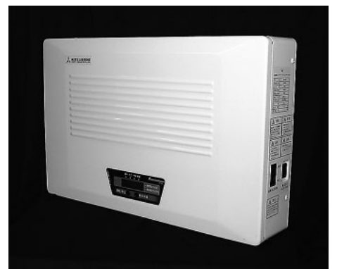
図2 ソーラーパワーコンディショナの外観