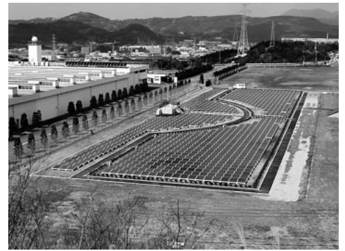
図4 公共・産業用コンクリート架台一体型太陽電池適用例