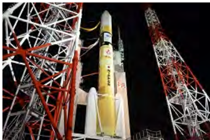
H-IIAロケット25号機 射点に向け機体移動中