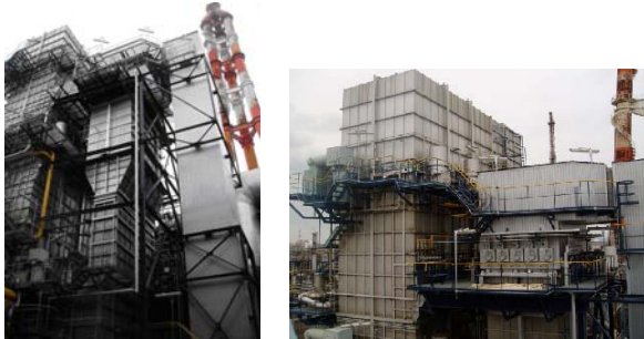
発電排煙処理プラント