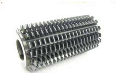
新組成コーティングホブ