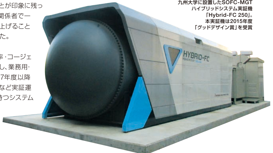
九州大学に設置したSOFC-MGT ハイブリッドシステム実証機 「Hybrid-FC 250」。 本実証機は2015年度 「グッドデザイン賞」を受賞

今後は、SOFC-MGTハイブリッドシステムの高効率・コージェネレーション、静粛性・環境性等の優れた特長を生かし、業務用・産業用分野への導入を図りたいと考えています。2017年度以降の本格的な市場投入に向け、今後、長期耐久性の検証など実証運転を重ね、お客様の評価をいただきながら商品力を持つシステムへ改良し、さらなる低コスト化を図ります。さらに、本システムの水素ステーションへの応用や、再生可能エネルギーの利用などの付加価値創出により、普及を加速させていきたいと考えています。