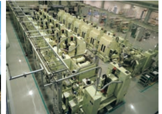
放電精密加工研究所専用生産ライン