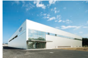
放電精密加工研究所新工場

現在は、燃焼器や燃焼器ケースのクラスター立ち上げに取り組んでおり、順次、対象部品や機種、参画企業を拡大していく予定です。また、MRJの機体部品製造においても、同様のスキームの水平展開によるクラスター形成が三重県松阪市で進められています。本活動で得たノウハウを活用し、日本の航空機産業の裾野を広げていきたいと考えています。