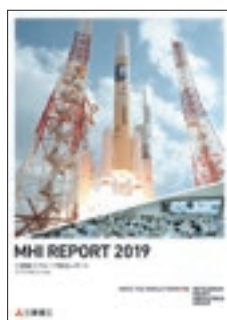
MHIレポート2019 表紙写真 H-IIAロケット40号機 (2018年10月打上げ)