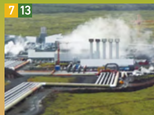
7 13 地熱発電プラント