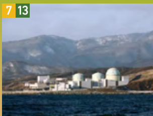
7 13 加圧水型原子力発電プラント