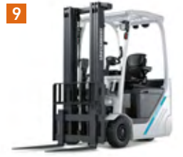
電気式3輪カウンタ バランス式フォークリフト