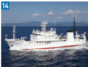
14 漁業調査練習船(天鷹丸)