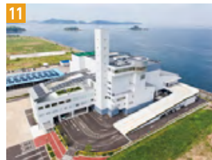
11 ごみ焼却発電施設