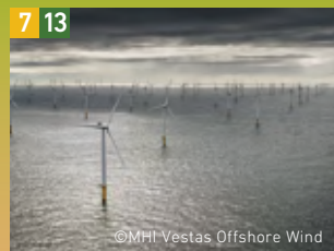
7 13 洋上風車 V164-8.0MW