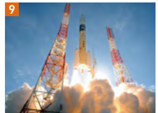
ロケット打上げ輸送サービス