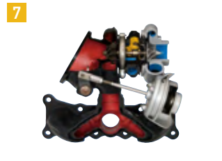
ガソリン用ターボチャージャー