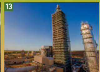
13 CO 2 回収プラント