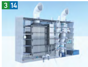
船舶用排ガス浄化装置