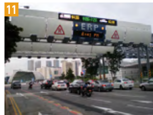
11 ITS(高度道路交通システム)