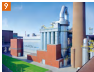
排ガス再循環式焼結設備 (MEROS)