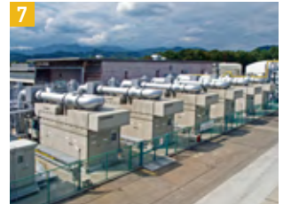
高効率ガス発電システム