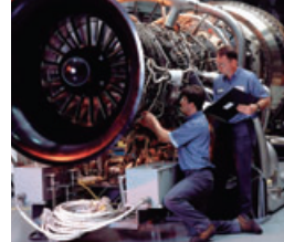
米Pratt & Whitneyの航空機エンジン転用型ガスタービン