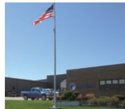
Federal Broach Holdings, LLC外観