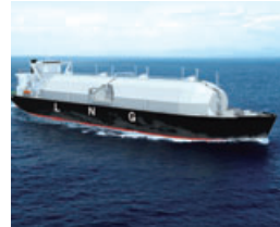
次世代型LNG運搬船「さやえんどう」