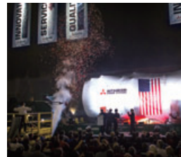
サバナ工場ガスタービン初号機出荷式典の様子