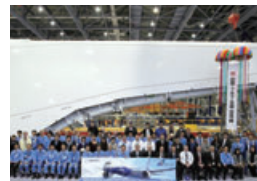
ボーイング787型機向け複合材主翼100号機目の出荷式典