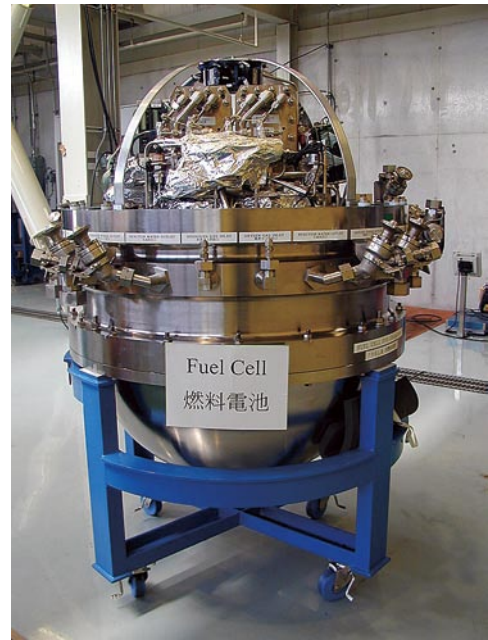
図3 燃料電池 ビークル燃料電池耐圧容器に搭載した燃料電池本体の写真を示す。

の2地点間を繰返し往復自律航走する長距離航走試験を実施した。深度800m、平均速力約3ktで連続56時間の自律航走を行い、AUVとして世界最長記録である317km連続長距離航走を達成した。