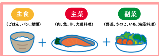
「10食品群」の頭文字をとった合言葉 (図1)