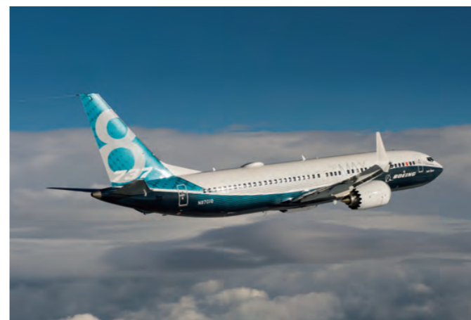
製造担当部位：内側フラップ