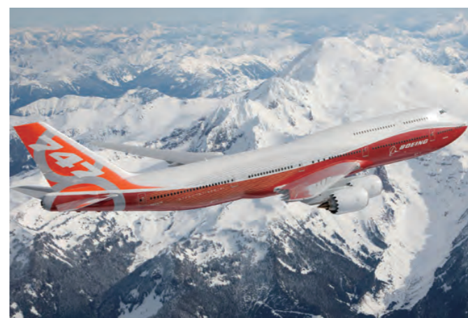
製造担当部位：中央翼