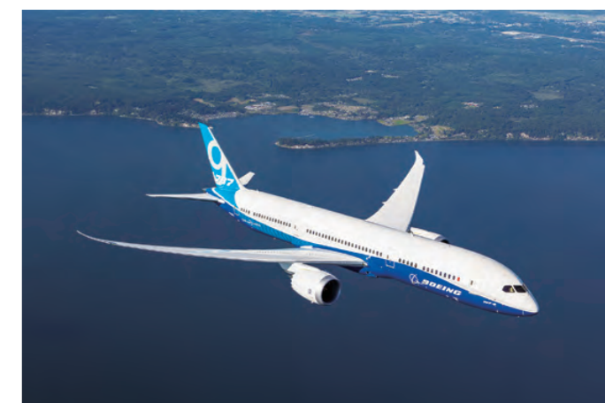
製造担当部位：複合材主翼ボックス