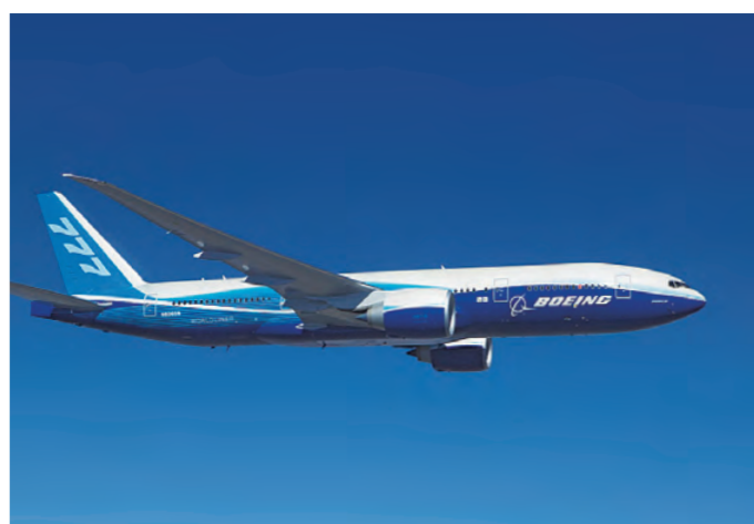
製造担当部位：後部胴体、尾胴、乗降扉