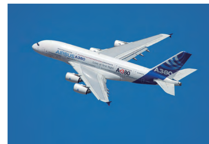
製造担当部位：前方・後方貨物扉