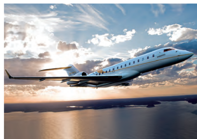
製造担当部位：主翼、中胴 / 中央翼