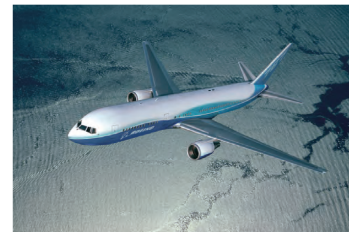
製造担当部位：後部胴体、貨物扉